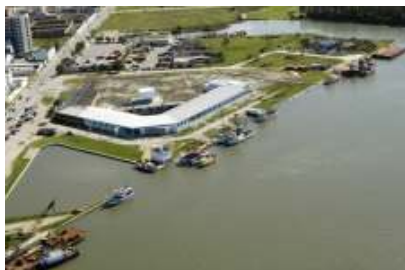
Construção do Centro de Convívio dos Meninos do Mar - CC Mar

A FURG continua, com firmeza e determinação, projetando o futuro com novas iniciativas e ações voltadas para o ensino, pesquisa, extensão e desenvolvimento da cidade e região.