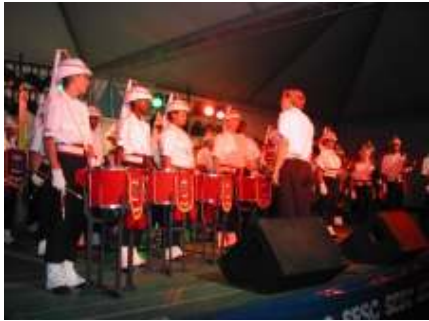
A Banda do CTI é destaque nacional e internacional