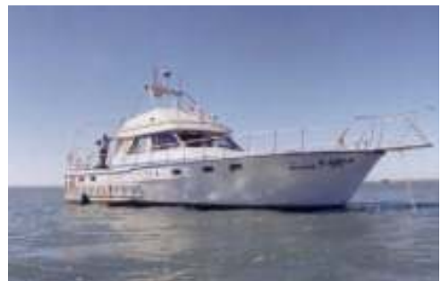
Lancha Oceanográfica Larus