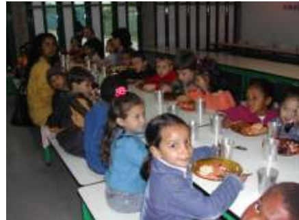
No CAIC formam-se os cidadãos do futuro