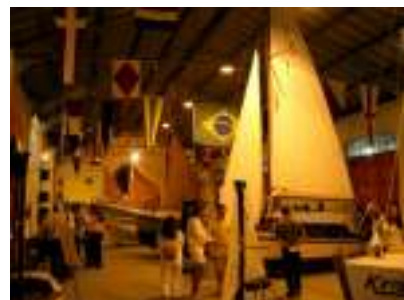
Modernização do Museu Náutico