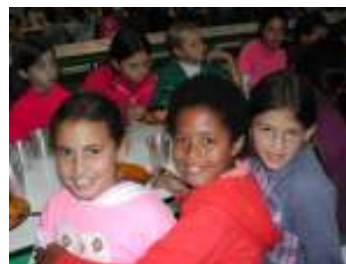
Alunos do CAIC

A FURG atende desde o ensino fundamental através do Centro de Atenção Integral à Criança e ao Adolescente (CAIC) onde estão matriculadas 772 crianças, que frequentam da 1ª à 8ª série, escola que funciona como um amplo laboratório e Colégio de Aplicação, onde são desenvolvidos também inúmeros projetos de extensão com o envolvimento da comunidade, até o ensino de pós-doutorado.