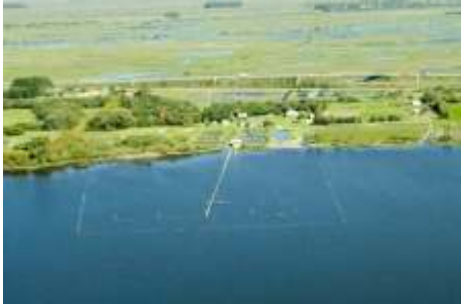
Laboratório de Aquacultura Continental-Saco do Justino