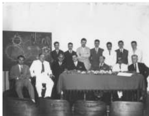
Aula inaugural da Escola Engenharia Industrial

Dispondo de espaços privilegiados, todos na cidade do Rio Grande, a FURG possui três campus e diversas outras instalações para a prática do ensino, da pesquisa e da extensão à comunidade.