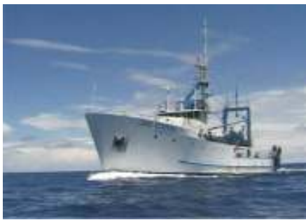
Navio Oceanográfico Atlântico Sul