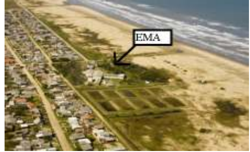
Laboratório de Aquacultura Continental-Saco do Justino