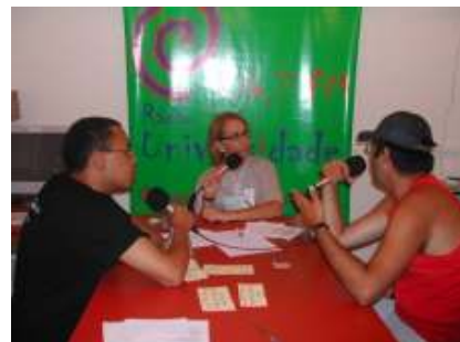
A Rádio Universidade FM 106.7, mantém diversificada programação informativa e cultural.