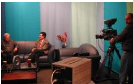
A FURG TV é um veículo de comunicação e divulgação das atividades e ações da Universidade